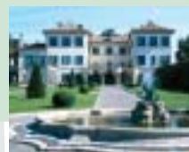
Villa Menafoglio Litta-Panza